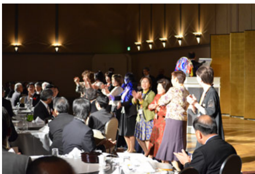
女性会員によるコーラス（♪君よ振りむくな）