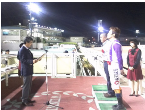
2012年9月21日 園田競馬ライオンズカップ