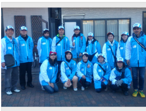
2012年11月25日 神戸マラソン給水ボランティア