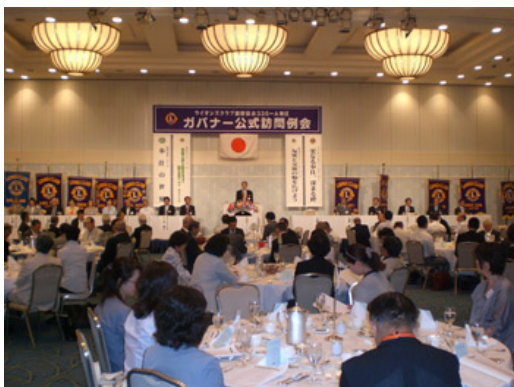
2012年8月 ガバナー公式訪問例会