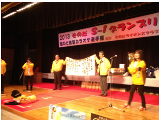
2013年2月23日 S1グランプリ