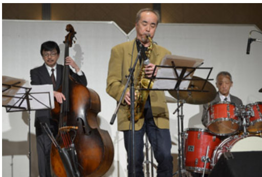
クインテット「ジャズライブ」