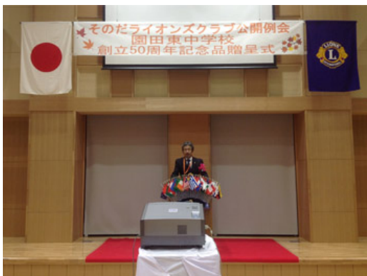
2012年10月22日 公開例会・園田東中学校 50周年記念品贈呈式