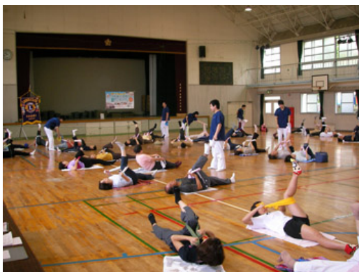
2012年9月23日 ゆがみ改善体操教室